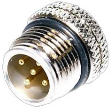
M12, 5P オス A Coded