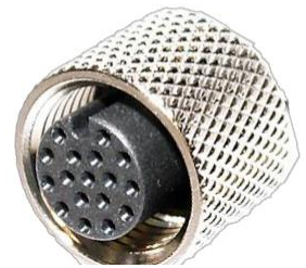
M12, 17P メス A Coded