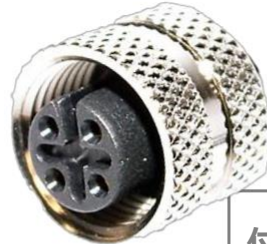
M12, 4P メス A Coded