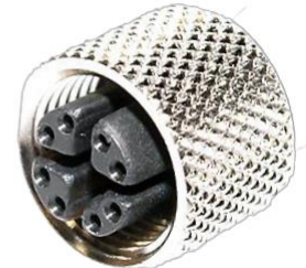
M12, 8P メス X Coded