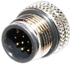
M12, 12P オス A Coded