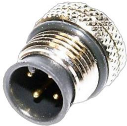
M12, 4P オス A Coded