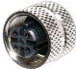
M12, 4P メス D Coded