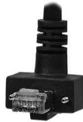
水平ネジ付き 上引き出し RJ45