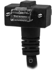
水平ネジ付き 下引き出し RJ45