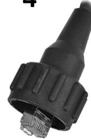
RJ45 ストレート IP67 Industrial