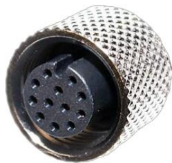
M12, 12P メス A Coded