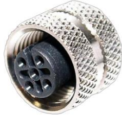
M12, 5P メス A Coded