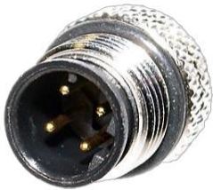
M12, 4P オス D Coded