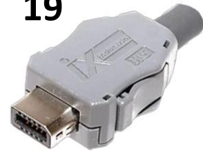
IX-10A Industrial Ethernet