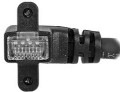
垂直ネジ付き 左引き出し RJ45