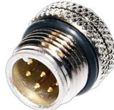
M12, 8P オス A Coded