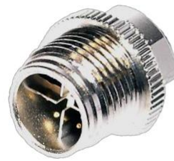
M12, 8P オス X Coded