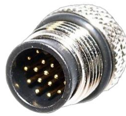
M12, 17P オス A Coded