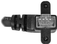
垂直ネジ付き 右引き出し RJ45