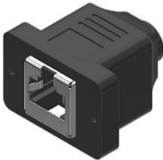
M12 90° ライトアングル X-Coded メス