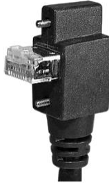
垂直ライトアングル 下引き出し RJ45