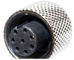
M12, 8P メス A Coded